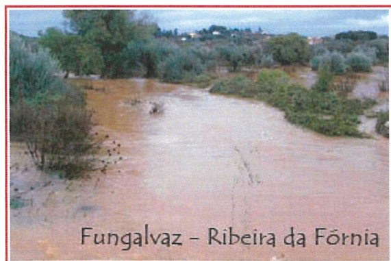
Fungalvaz – Ribeira da Fórnia

Manutenção e limpeza dos Cemitérios da Freguesia Arranjo do muro do Cemitério em Fungalvaz